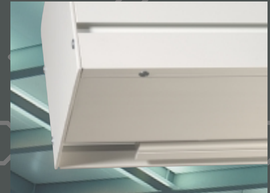
Abbildungen: ProfiIntegral in RAL-Ausführung